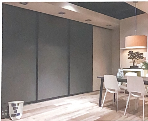
Großflächigkeit wirkt beruhigend: Hier verdecken drei XXL-Gleittüren mit schwarz pulverbeschichtetem Rahmen und Dekor-Füllung eine komplette Küchenzeile. Wird gekocht, „parken“ sie hintereinander vor einer Wand.

Raumplus hat mit Nobilia, seit 2021 Gesellschafter mit 50 Prozent der Anteile, einen starken Partner. Noch ist der Umsatzanteil an Küchenlösungen gering, aber er bietet durch den Trend zum offenen Wohnen viel Potenzial. Küchenstudios können mit Raumplus Zusatzgeschäfte generieren, da sich mit Gleittüren nicht nur Küchen „tarnen“, sondern auch Übergänge zu anderen Räumen elegant gestalten und Nischen nutzen lassen.